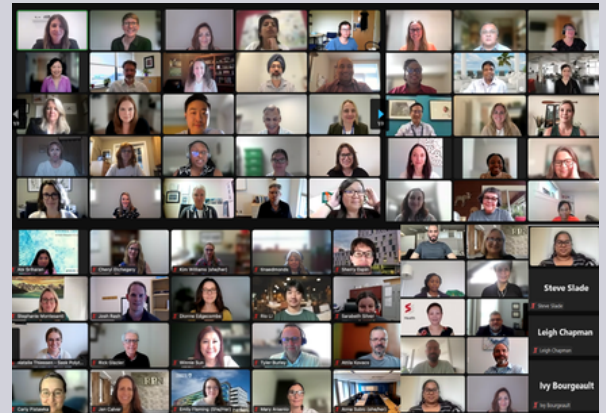
Atelier d'orientation - 26 juin, 2024

L'Institut des services et des politiques de la santé des IRSC collabore avec des partenaires pour financer la recherche axée sur les solutions, renforcer les capacités, favoriser la mobilisation des connaissances et appuyer les mesures fondées sur des données probantes qui aideront à créer un effectif du personnel de la santé qui soit plus robuste, sain, résilient, diversifié et équitable.